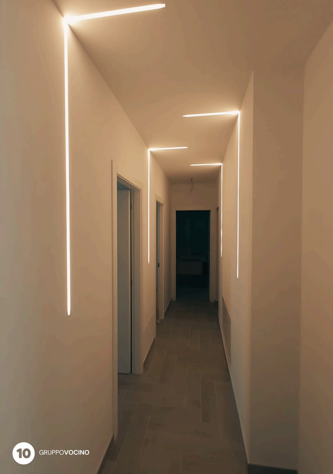
Immagine reale di nostre realizzazioni