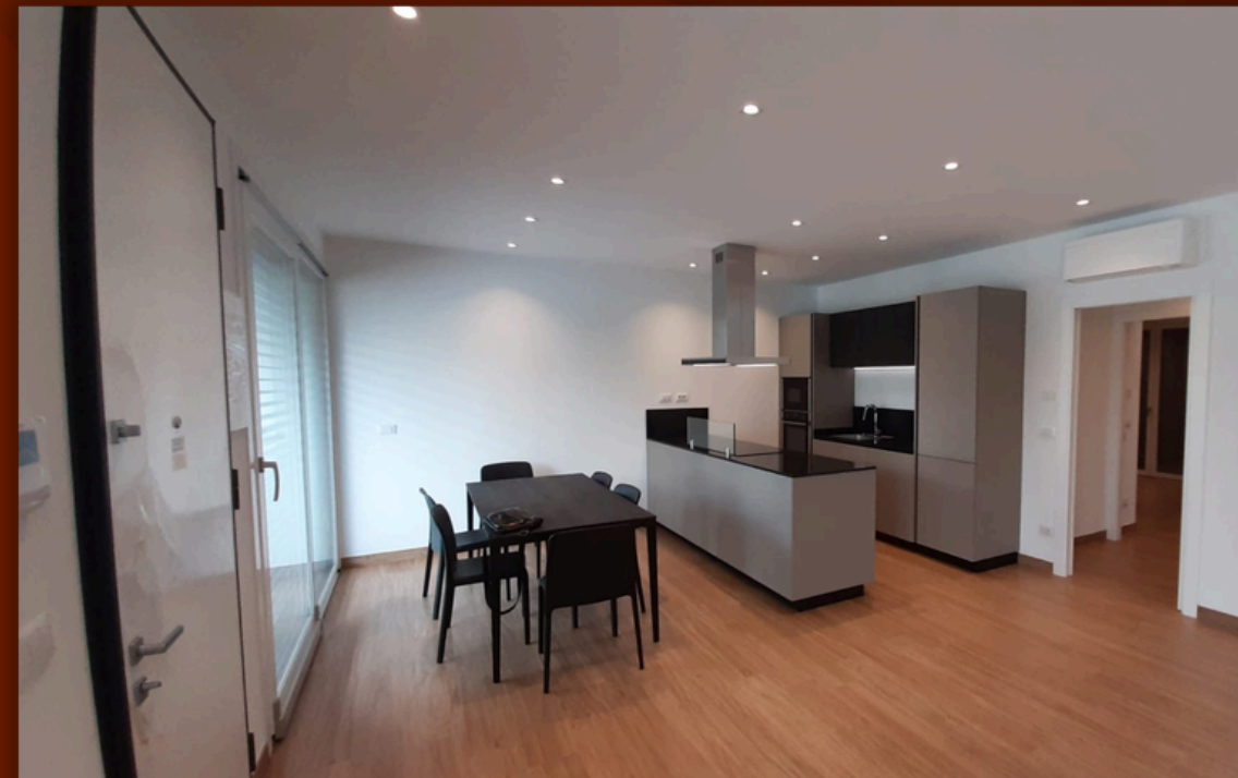
Immagine reale di nostre realizzazioni