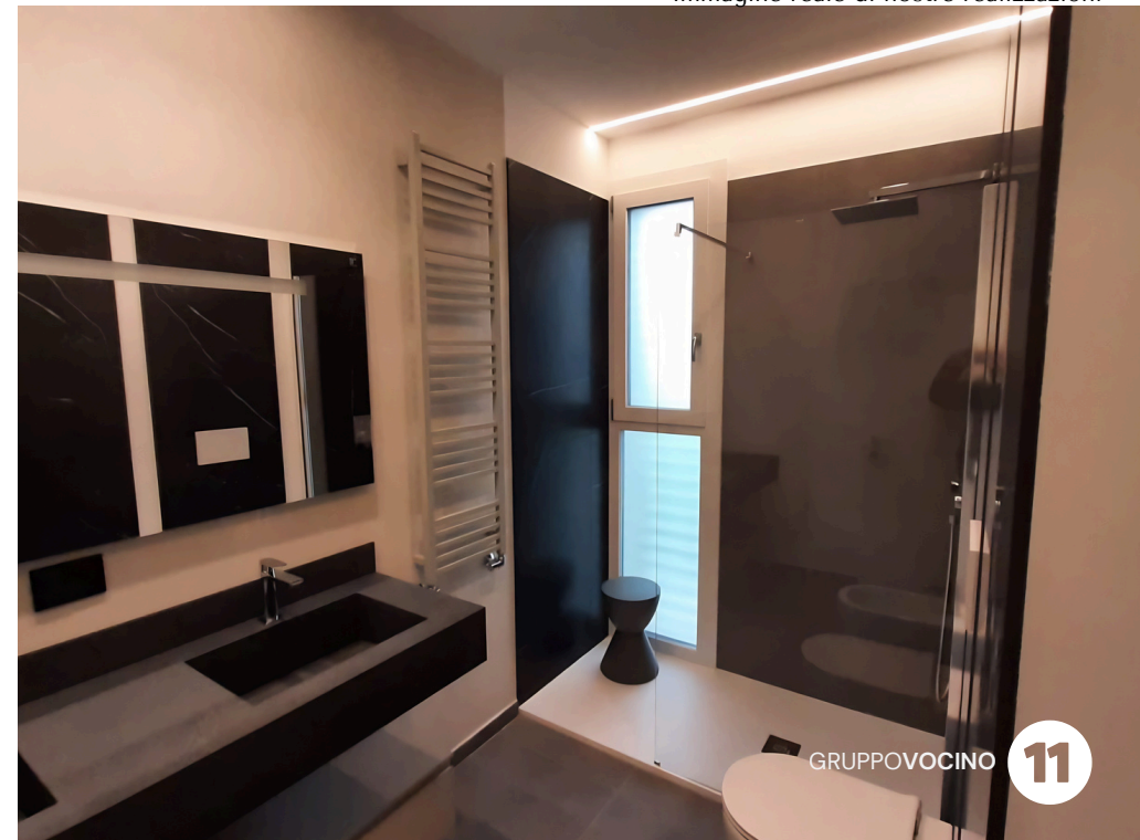
Immagine reale di nostre realizzazioni

Nei bagni tutte le pareti saranno rivestite per un'altezza di cm. 220 circa o comunque del multiplo intero delle piastrelle. I rivestimenti saranno in gres ceramico di prima scelta fra i campioni da visionare presso la Ditta esecutrice dalla Parte promittente l'acquisto.