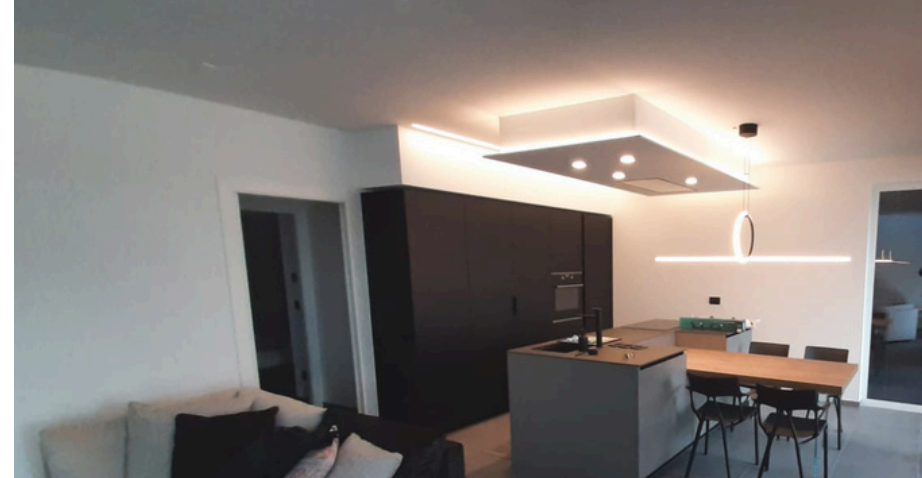
Immagine reale di nostre realizzazioni®