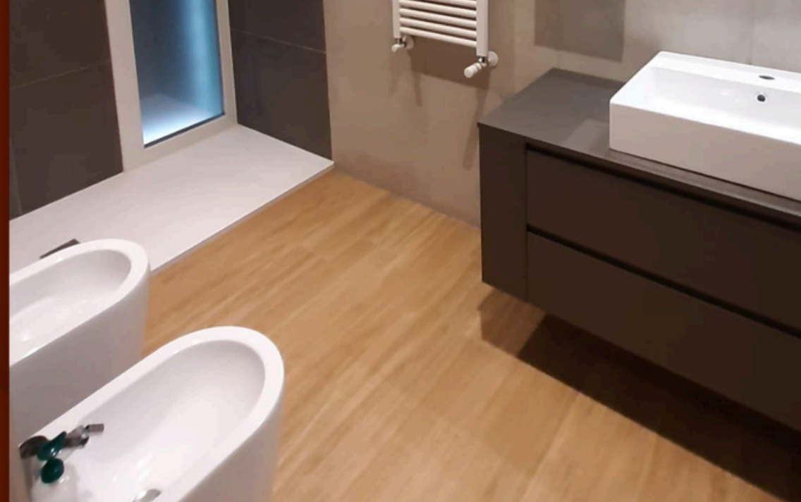
Immagine reale di nostre realizzazioni